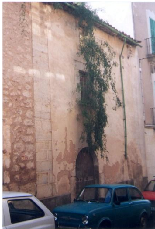
Fotografia del catàleg anterior