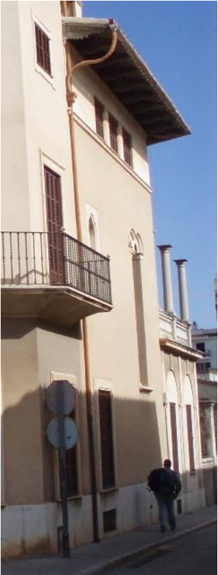
Fotografies de l catàleg anterior