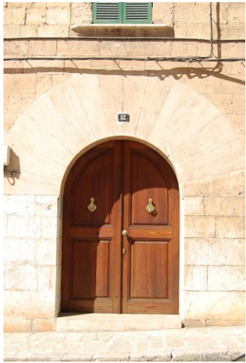
Fotografia del catàleg anterior