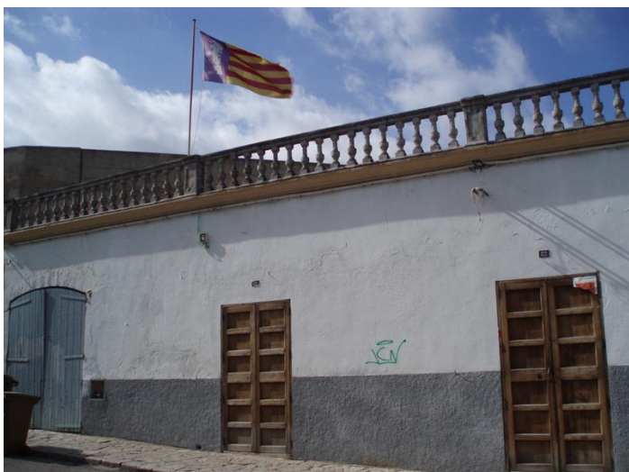
Fotografies extretes del catàleg anterior