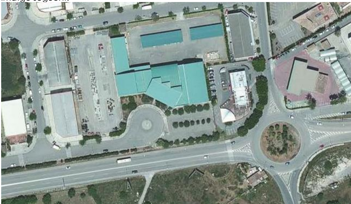
Imatge 3. Ortofotografia de l'estat actual.

Es tracta per tant d'una zona antròpica de caràcter industrial embeguda en una matriu d'infraestructures viàries capacitat mitjana, tal com es pot observar de la imatge següent: