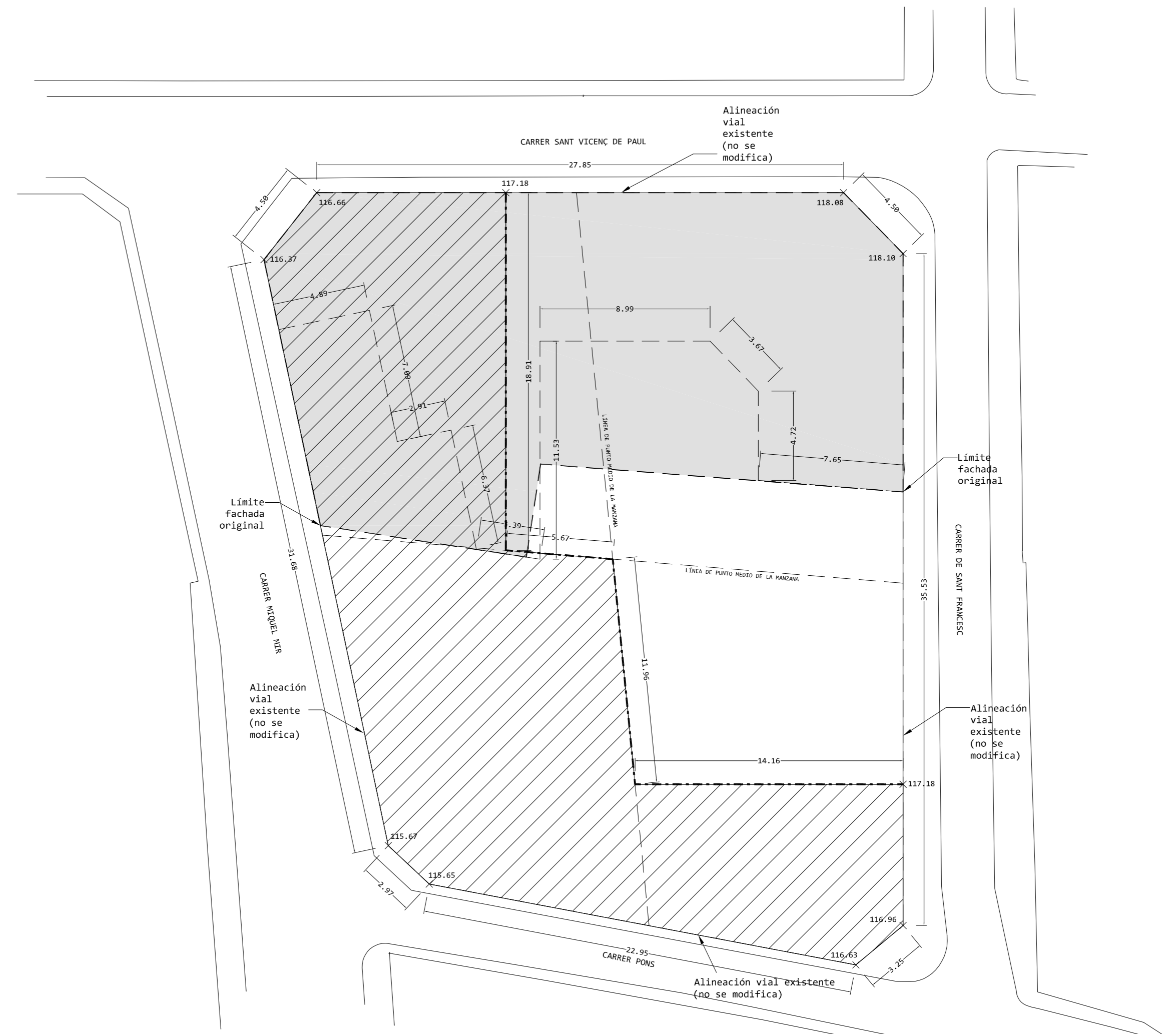
PROPUESTA ESTUDIO DE DETALLE - PLANTA NIVEL +115.24

----- LINEA DE REFERENCIA SEGÚN DEFINICIÓN DE PLANTA BAJA ART. 126 PGOU