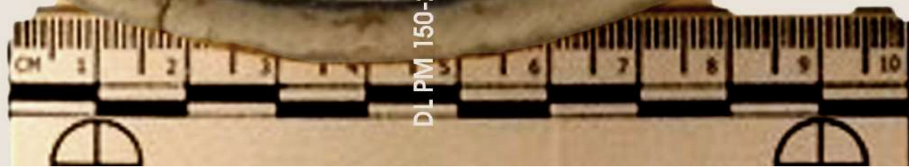
D.L. PM 150-2020 Fotografia: Ceràmica medieval d'Inca. Magdalena Sasfre Morro