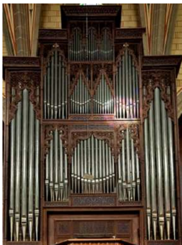
ORGUE DE LA CATEDRAL DE PERPINYÀ