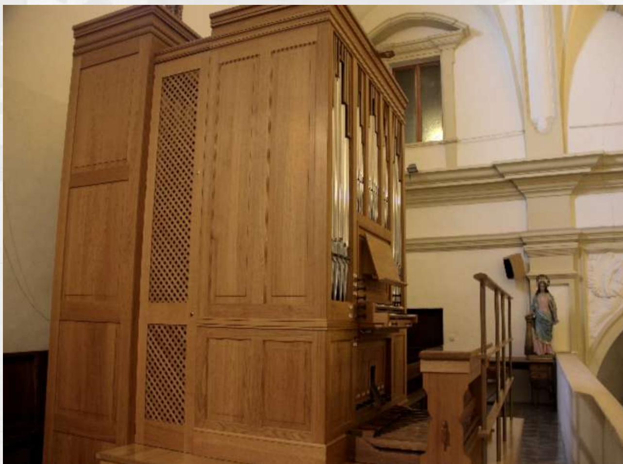
NOU ORGUE GRENZING DE SANT FRANCESC

Voldria que aquest recorregut hagi servit per apropar-nos i conèixer millor el ric i variat patrimoni organístic inquer. Només des del seu coneixement pot ser valorat com es mereix. Albergar tres orgues històrics d'aquesta qualitat és un privilegi, però a la vegada una responsabilitat que fa que s'hagin d'invertir suficients esforços per a la seva adequada conservació.