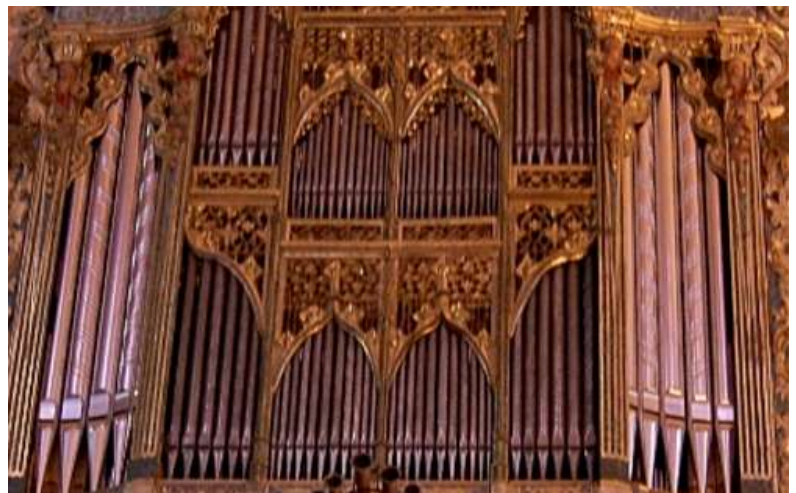
ORGUE DE LA BASÍLICA DE SANT FRANCESC DE PALMA