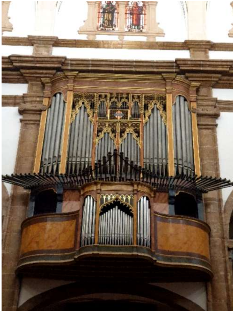
ORGUE DE LA PARRÒQUIA DE SANTA MARIA LA MAJOR

No és d'estranyar que, essent Santa Maria la més antiga de les tres parròquies d'Inca i l'única que existí fins arribat el s. XX, la història de l'orgue o dels distints orgues que hi ha hagut al seu interior sigui la més extensa. De totes formes cal dir que l'església actual no fou iniciada fins a l'any 1706; per tant, tots els orgues documentats anteriors a aquesta data són instruments que varen construir-se per a l'antiga església de Santa Maria del s. XV. Hi ha constància documental d'orgues en aquesta parròquia com al s. XV (1419). El s. XVI trobam un orguener de la família Roig treballant a Inca. Part de la caixa d'aquest instrument gòtic es conserva encara a la part central de la caixa de l'orgue que ha arribat als nostres dies. Com a curiositat, presenta nombroses similituds amb l'orgue de la catedral de Perpinyà i de la basílica de Sant Francesc de Palma, instruments de la mateixa època i construïts també per aquest mateix orguener, com es fa palès a les fotografies a continuació.