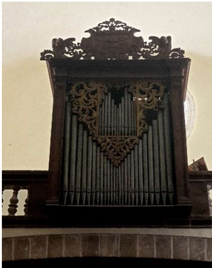
ORGUE DE LA PARRÒQUIA DE SANT DOMINGO

L'orguener mallorquí Pere Reynés posà a punt l'instrument a l'any 1988, i va recompondre els registres de mixtura segons els cànons habituals dels Caymari, que havien arribat als nostres dies modificats segons modes pseudoromàntiques després de la reforma de 1908.