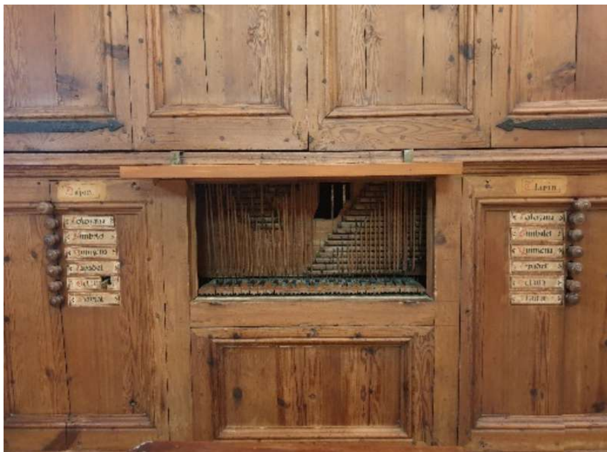
TECLAT I TIRADORS DE REGISTRE

Aquesta característica, molt útil sobretot als orgues d'un sol teclat, possibilita que l'organista pugui escollir diferents sonoritats a cada una de les dues meitats del teclat, i destacar una melodia a la part dreta o esquerra d'aquest. D'aquesta forma se "simula" que l'orgue disposa de dos teclats quan en realitat només en té un.