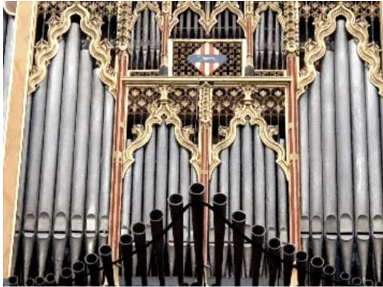
PART CENTRAL GÒTICA DE L'ORGUE