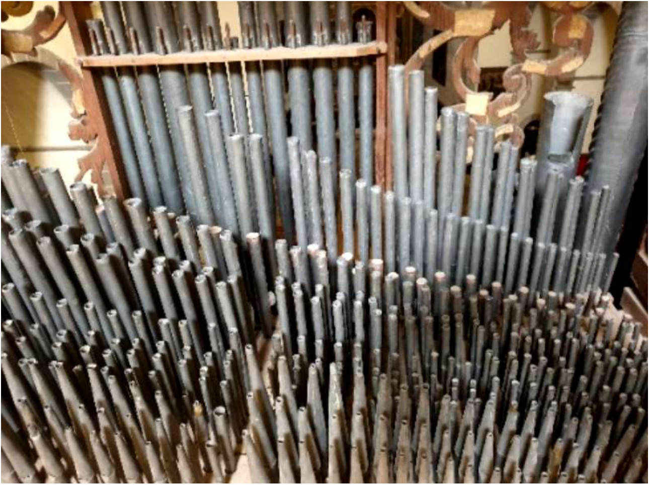
TUBS DE L'INTERIOR DE L'ORGUE

La disposició dels seus registres és la següent: