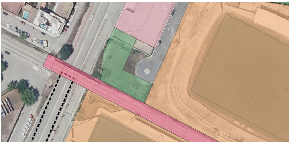
1. Plànol d'ordenació del PGOU sobre ortofotografia 2021

El ELP apareix al PGOU amb una superfície de 1.314m 2 , però s'ha detectat un error material provinent de la cartografia perquè els seus límits es superposen amb la parcel·la cadastral 2964006DD9926S amb qualificació d'edificació aïllada plurifamiliar especial.