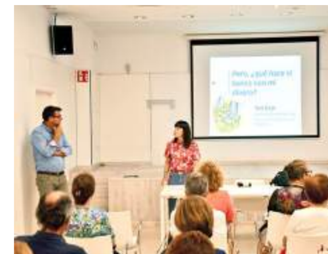
Detall de la darrera UOM del 2022.