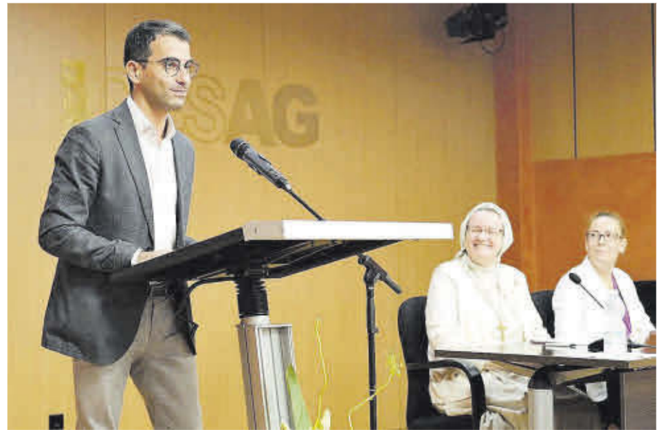
CESAG El conseller de Universidades, Miquel Company, durante su discurso.