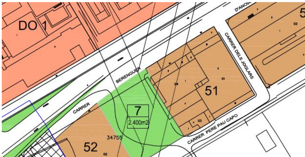
Plànol de proposta de la qualificació del sòl del PGOU.

2.- El PGOU vigent classifica i qualifica una part del sòl urbà com a industrial (amb la clau 52) i espai lliure públic amb la clau núm. 7 de 2.516 m 2 de superfície. En la realitat, actualment, aquesta zona verda es troba encara sense urbanitzar com a espai lliure i transitòriament s'utilitza com a aparcament públic, connectant els carrers de Berenguer D'Anoia i de Pere Pau Capó.