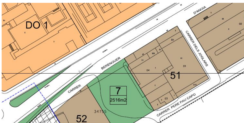
Plànol de qualificació del sòl del PGOU.

Aquest PGOU qualifica l'espai lliure públic núm. 7 de 2.516 m 2 de superfície, situat entre el carrer Berenguer D'Anoia i Pere Pau Capó, i l'ordena de tal forma que es troba annex a les parcel·les assenyalades amb la clau 51, qualificada com a industrial en ordenació per alineació a vial, i 52, qualificada com a industrial en ordenació per edificació aïllada.