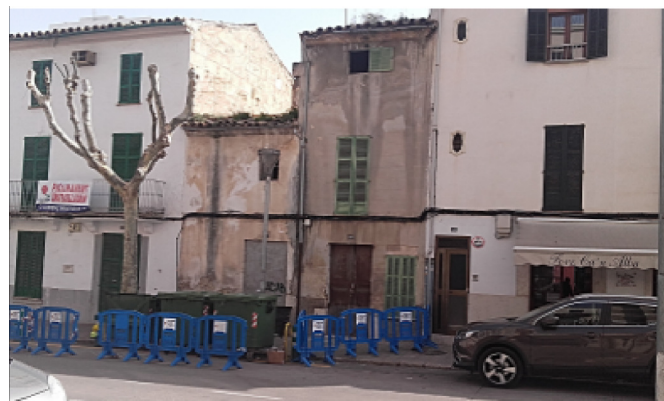
FACHADA AVDA. GRAL LUQUE