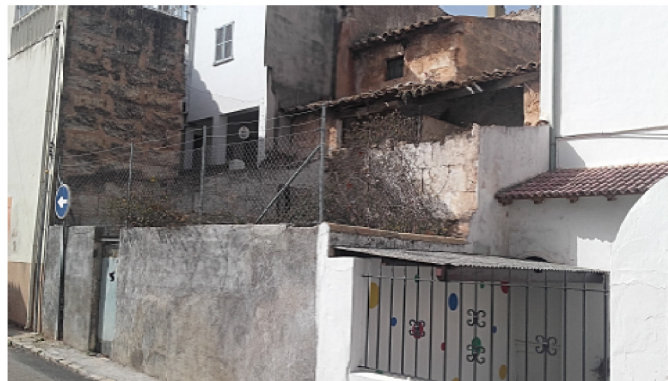
FACHADA C/ TORRETA