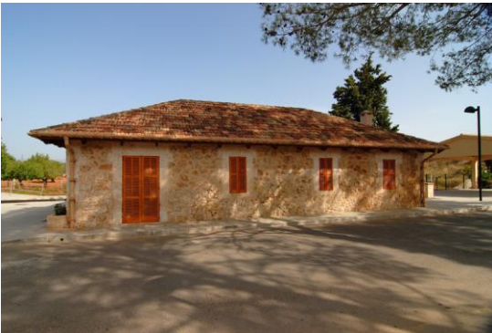
Fotografies del catàleg anterior (abans de la seva reforma)