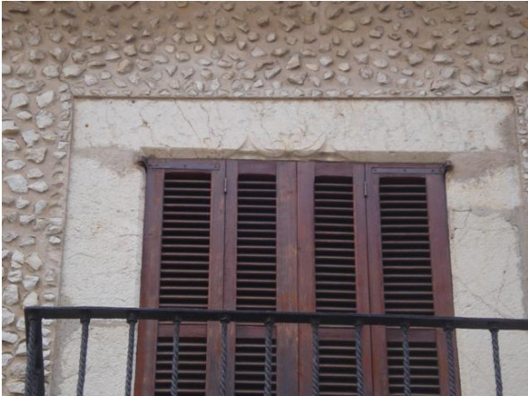
Fotografia del catàleg anterior