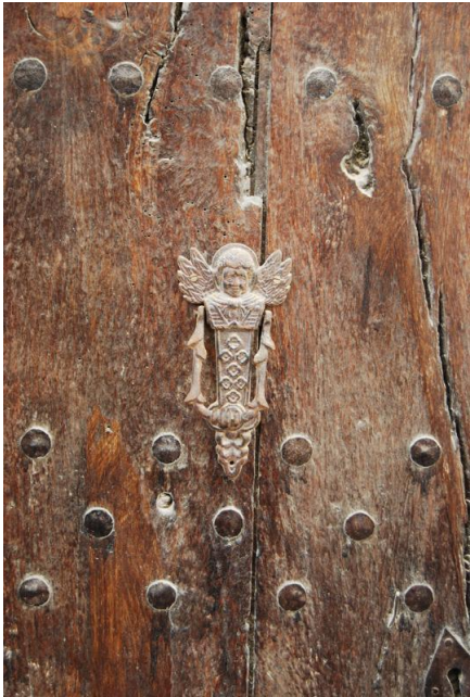
Fotografia del catàleg anterior