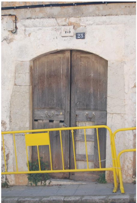
Fotografia del catàleg anterior