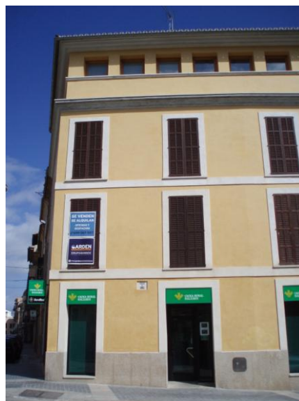
Fotografia de l'anterior catàleg de patrimoni, abans de la restauració integral