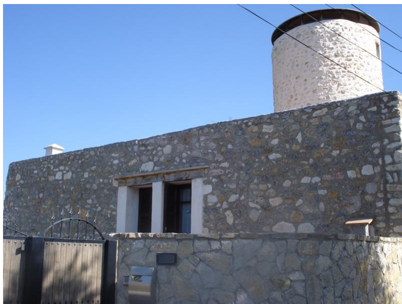
Fotografies del catàleg anterior