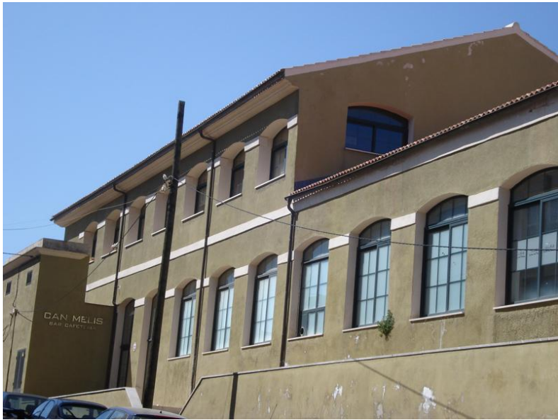
Fotografies del catàleg anterior